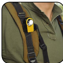
Κλιπ Τσέπης/ Ζώνης