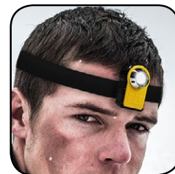
Μεταμορφώνεται σε Φακό Κεφαλής