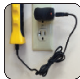
Καλώδιο Φόρτισης Micro USB