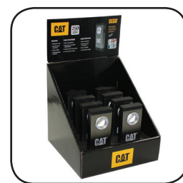
CT51108 Χάρτινο Εκθετήριο